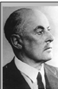
Hubert Pierlot (1883-1963) fut premier ministre belge de février 1939 à février 1945.

Il est clair que les conflits d'intérêts n'étaient pas moins présents au sein du comité d'unification et que les CLS se sont isolés à plusieurs reprises. Néanmoins, début janvier 1945, les pourparlers se terminèrent avec un accord qui devait ouvrir la voie à une fusion. Les instances dirigeantes des quatre organisations syndicales avaient jusqu'au 31 janvier pour approuver les textes fondamentaux. Cette dernière phase s'avéra presque insurmontable.